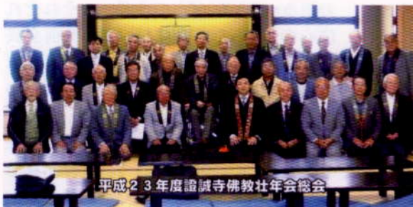
平成23年度證誠寺佛教壮年会総会