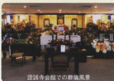
證誠寺会館での葬儀風景

浄土真宗 門徒であれば、どなたでもお気軽に證誠寺会館をご利用いただき、通夜・葬儀を行うことができます。各葬儀社の互助会にご加入の方も問題なくご利用可能です。